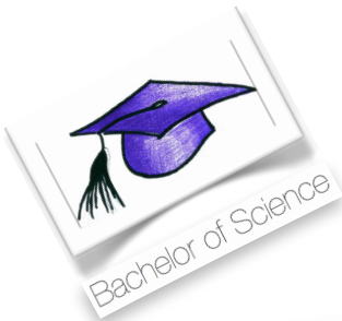
Bachelor of Science

2012 war hart. Etwas anderes zu behaupten, wäre gelogen. Aber es hat auch riesig Spaß gemacht. Wir haben gelacht, uns belächelt, genervt, zusammengerauft, die Macken des jeweils Anderen kennen- und aushalten gelernt, Ideen mit Hilfe von Wein entwickelt und die ein oder andere mit Arbeit um die Ohren geschlagene Nacht verbracht. Kurz um, wir sind zusammengewachsen und haben PROGRESS erschaffen. Das macht uns wahnsinnig stolz. Doch all dies wäre ohne einen unmöglich gewesen: Dich! Denn PROGRESS lebt durch seine Mandanten und Du bist einer von Ihnen. Dafür danken wir dir! Hier haben wir mal zusammengetragen, was wir 2012 eigentlich alles geschafft haben: